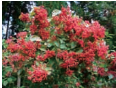
ガマズミ (岩手県) (34ページ参照)