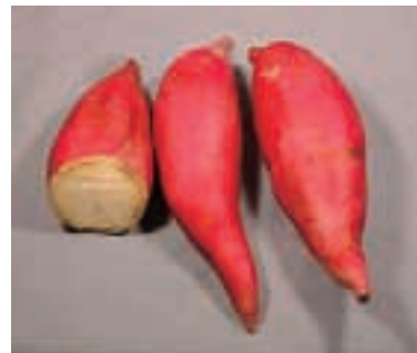
「クイックスイート」の外観 (21ページ参照)