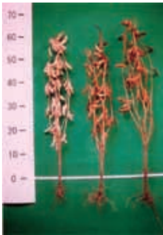
「フクユタカ」(左)、「クロダマル」(中央)、「新丹波黒」(右)の草姿 (18ページ参照)