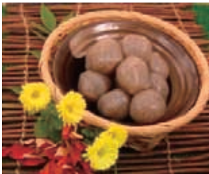
こんにゃく (群馬県) (9ページ参照)