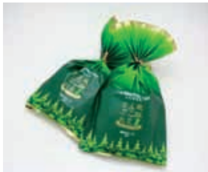
エゴマ子実入りサブレ (岐阜県飛騨市) (43ページ参照)