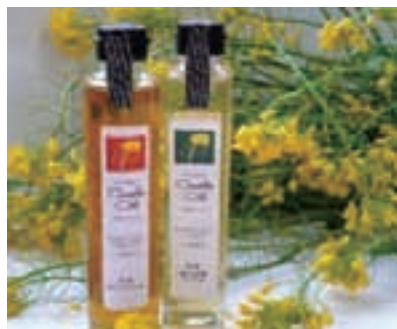
なたね油 (福岡県うきは市) (53ページ参照)