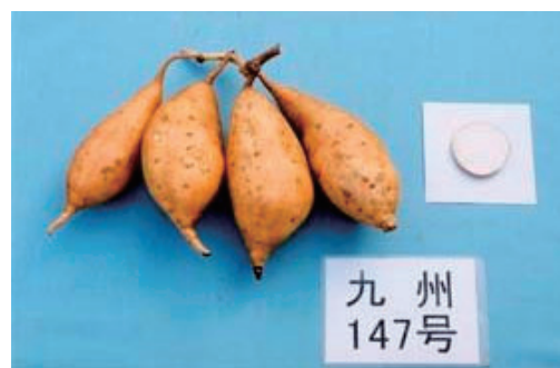
「オキコガネ」の外観 (21ページ参照)