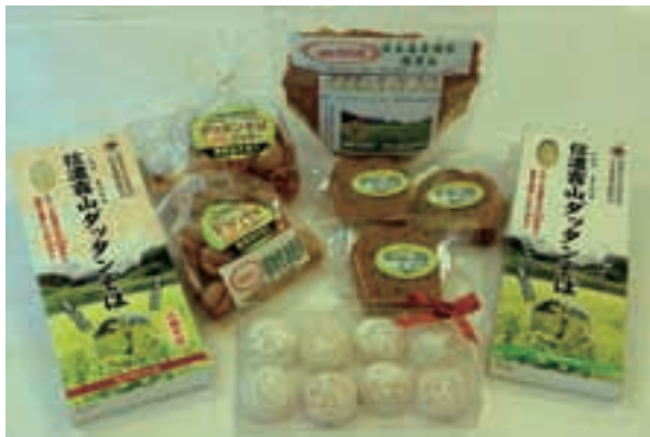
ダッタンそば商品 (長野県長和町) (39ページ参照)