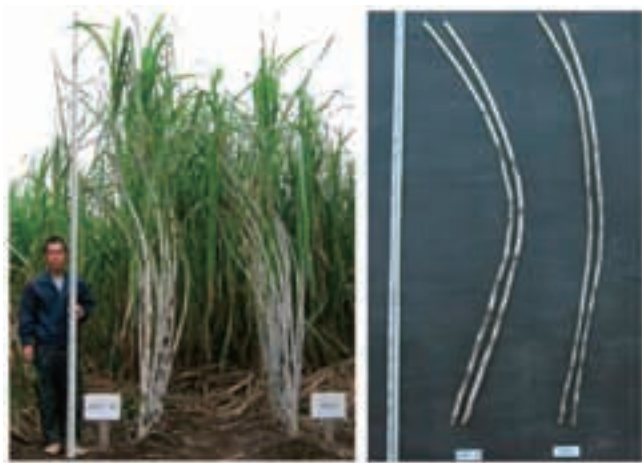
さとうきび「NiN24」の草姿(左)および脱葉茎(右) 各写真の左側は「NiN24」、右側は「NiF8」(16ページ参照)