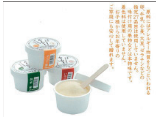
里芋アイス (福井県大野市) (41ページ参照)