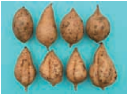
「サツママサリ」(上段)と「コガネセンガン」(下段)の塊根の外観 (16ページ参照)