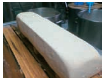
島豆腐 (沖縄県今帰仁村) (55ページ参照)