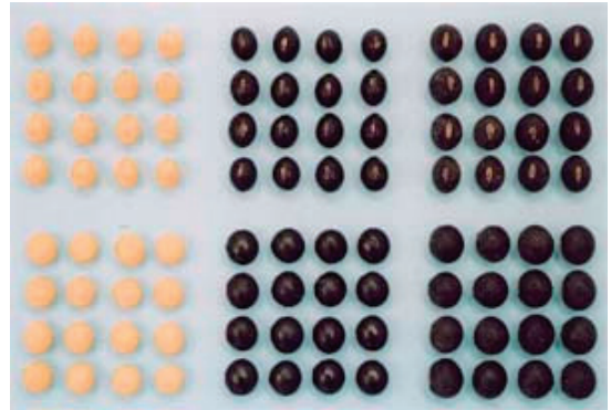
「フクユタカ」(左)、「クロダマル」(中央)、「新丹波黒」(右)の子実 (18ページ参照)