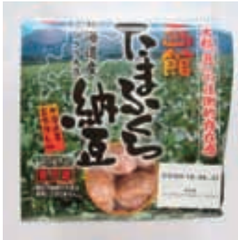
たまふくら納豆 (北海道) (33ページ参照)