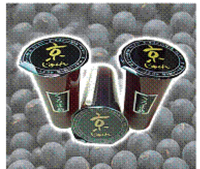
京じゅれ くろまめ (京都府南丹市) (46ページ参照)