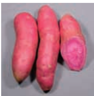
「パープルスイートロード」の外観 (21ページ参照)