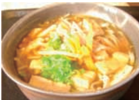
紅そば亭の一番人気「境そば」(岡山県美咲町) (50ページ参照)