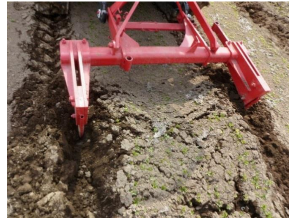
収穫① 専用ディガーによる苗掘り起こし（翌年4月）