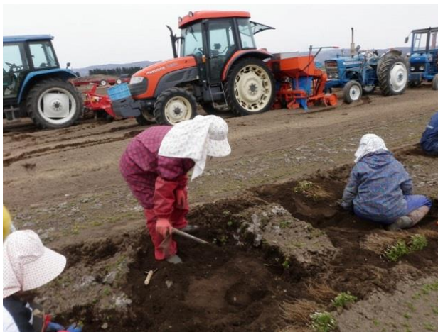
収穫② 苗の手取り収穫（翌年4月）