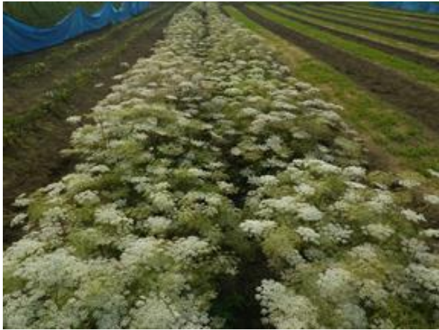
開花（翌々年 7 月）