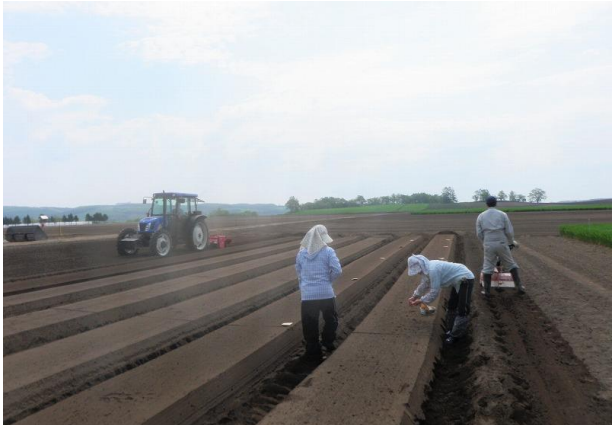
播 種 (6月)